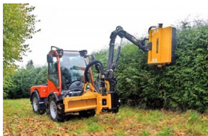
McConnell Armlippare med räckvidd 3,2-9 m för montage på traktor/mini-lastare eller redskapsbärare.