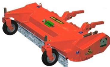
Agrimaster Slagklippare för redskapsbärare. Arbetsbredd 1,5-1,8 m.