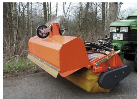
Tuchel sopmaskiner både med och utan uppsamlare för montage på alla typer av traktorer/minilastare & redskapsbärare. Arbetsbredd 1,35-2,8 m.