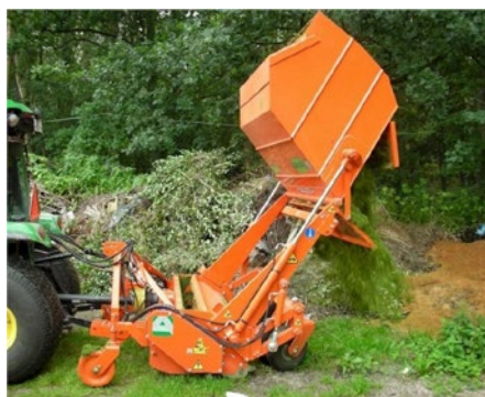
Agrimaster Slagklippare med uppsamlare. Arbetsbredd 1,6-1,9 m.