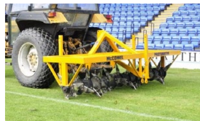
Olika typer av stickluftare från McConnell. Arbetsbredd 2,5-3 m.