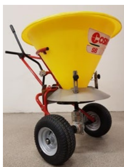
Cosmo sandspridare både som manuell modell samt bogserad.