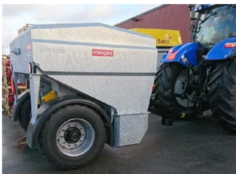
Fransgårds sandspridare upp till 5 000 l.. Finns både bogserade, självlastande och tallriksspridare i sortimentet.