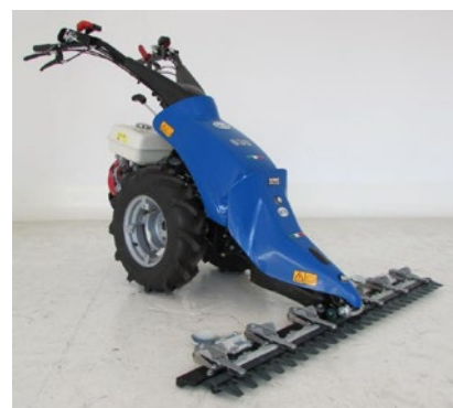
Enaxlade traktorer från välkända BCS - Tusenkonstnärer!