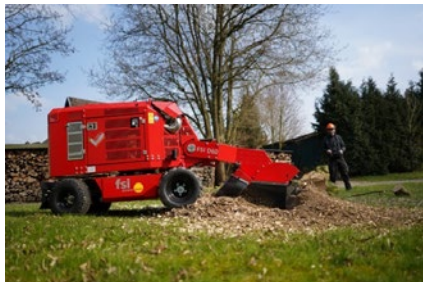
FSI Stubfräsar, manuella, självgående samt för montage på traktor/mini-lastare & redskapsbärare.